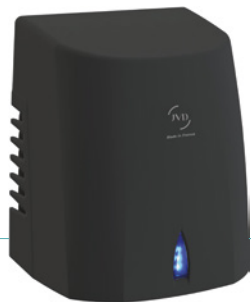
REF 8 11 1377 Copt'air automático aluminio negro UL!: 4