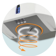
INNOVACIÓN BOQUILLA GIRATORIA PARA MEJOR EFICACIA Y NUEVA SENSACIÓN

+ REF 5 30 1899 Filtro antibacteriano UL!: 1