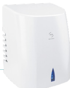
REF 8 11 1167 Copt'air automático aluminio blanco UL!: 4

+ REF 5 30 1899 Filtro antibacteriano UL!: 1