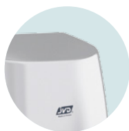
ANTIVANDÁLICA CARCASA DE ALUMINIO