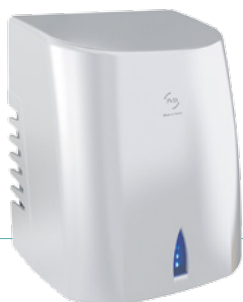
REF 8 11 1168 Copt'air automático aluminio gris metalizado UL!: 4