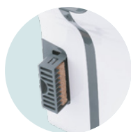
HIGIÉNICO FILTRO DE COBRE BACTERICIDA Y DEPÓSITO DE AGUA INTEGRADOS, TRATAMIENTO ANTIBACTERIANO DE LAS SUPERFICIES

+ REF 5 90 2014 Filtro de cobre Bactericida UL 1 : 1