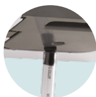
EVACUACIÓN DIRECTA CONEXIÓN AL DESAGÜE POSIBLE GRACIAS AL KIT EVACUADOR INCLUIDO