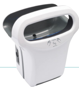
REF 8 11 791 Exp'air automático aluminio blanco epoxi UL 1 : 1

+ REF 5 90 2014 Filtro de cobre Bactericida UL 1 : 1