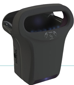
REF 8 11 1376 Exp'air automático negro epoxi UL 1 : 1