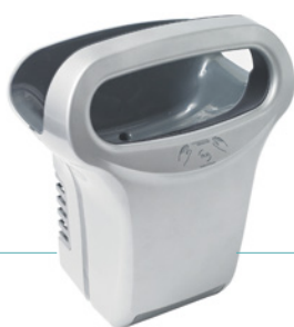
REF 8 11 822 Exp'air automático aluminio gris epoxi UL 1 : 1