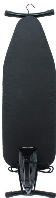
Tabla de planchar Swivel para hoteles: gran superficie de 968x330 mm, funda negra ignífuga de 10 mm, soporte de plancha giratorio integrado, gancho para colgar, elegante acabado en negro.